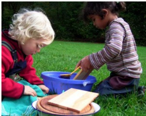
Escuela Waldorf al aire libre