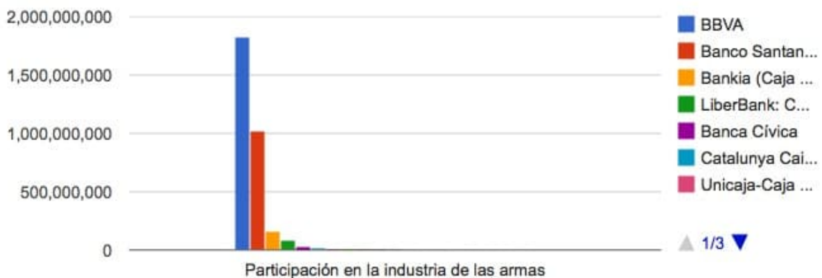
Grafico Banca Española

Ver ránking de los bancos que operan en España